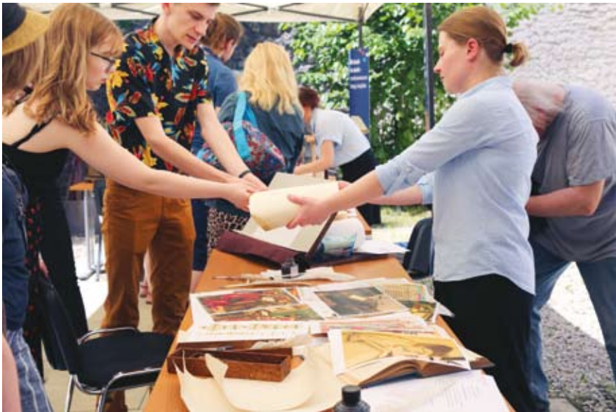
66. „Plenerowe Laboratorium Archiwalne”, stanowisko „Zapisane na skórze – średniowieczny dokument”, opieka merytoryczna: Anna Sokół, 8 czerwca 2019 r.