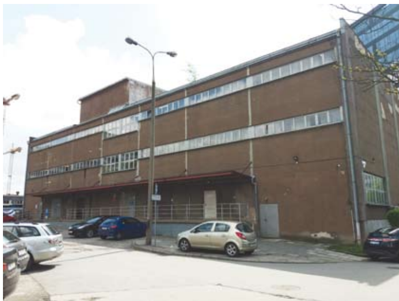
43. Dawna siedziba Archiwum Urzędu Miasta Krakowa przy ul. Dobrego Pasterza 116a