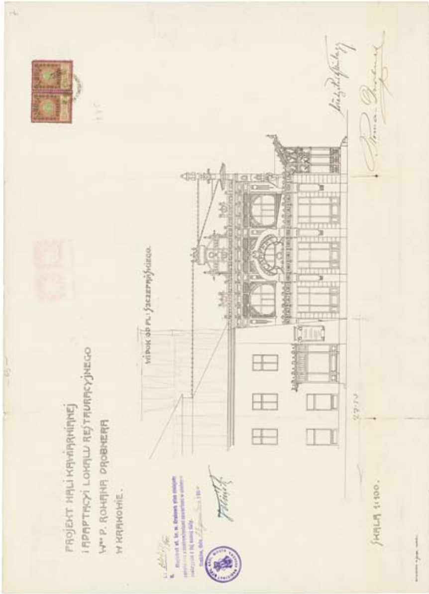
10. Проект хали кав'ярніанеї і адаптації локалу реставраційного Романа Дробнера в Кракові, Ян Завієйський, 1904 р. (АНК, Архівиум планів Будівництва Мієйського в Кракові, сьгн. АБМ плац Сачеурауфіааа 3, ф. 886а, пл. 7)