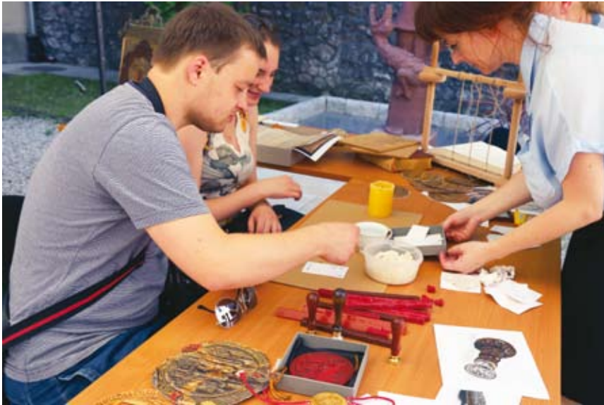
67. „Plenerowe Laboratorium Archiwalne”, stanowisko „Władcy zakłęci w wosku – królewskie pieczęcie”, opieka merytoryczna: Aldona Warzecha, 8 czerwca 2019 r.