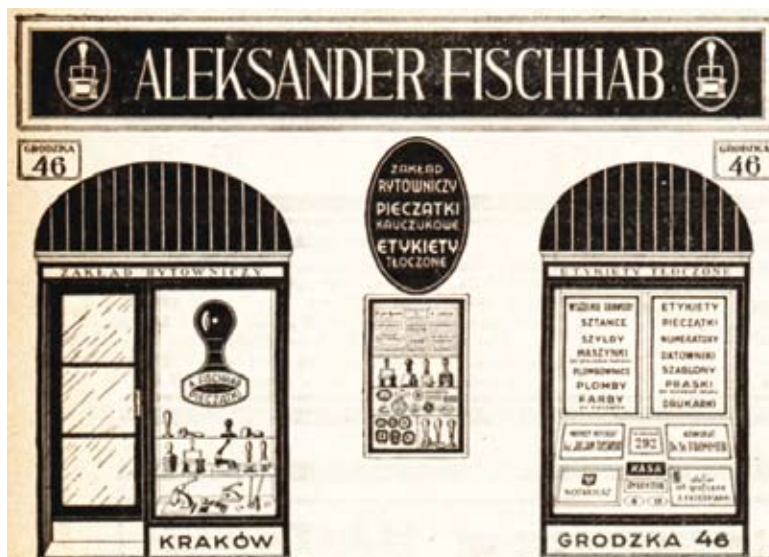
25. Ilustracja fasady parterowego lokalu przy ul. Grodzkiej 46 będąca ogłoszeniem zakładu rytowniczo-pieczętarskiego Aleksandra Fischhaba („Przegląd Kupiecki” 1935, R. 18, nr 38, s. 4)