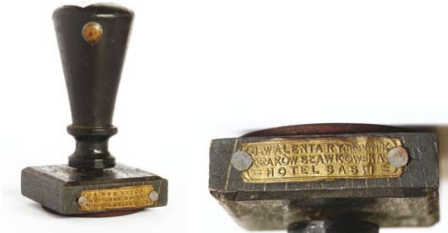
18.–19. Typariusz pieczętny Ministerstwa Spraw Zagranicznych II Rzeczypospolitej Polskiej Biuro w Krakowie, guma, drewno, wyk. Jakub Walenta, lata międzywojenne lub nieco późniejsze (do 1. poł. XX w.) (ANK, Zbiór tłoków pieczętnych metalowych, sygn. 29/661/576)