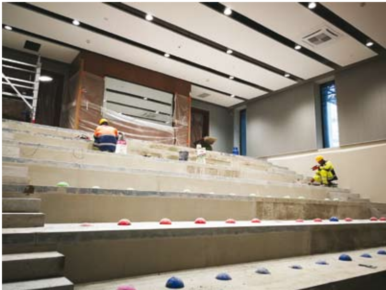
52. Budowa nowej siedziby Archiwum Narodowego w Krakowie. Widownia w sali audiowizualnej – widok przed zamontowaniem wyposażenia, stan z listopada 2019 r.