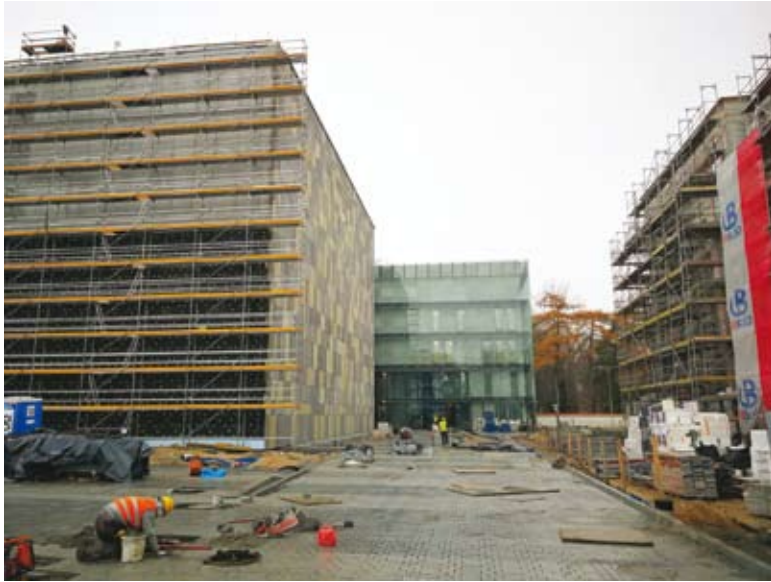
51. Budowa nowej siedziby Archiwum Narodowego w Krakowie. Segment magazynowy (na pierwszym planie) i segment biurowy (drugi plan) – widok od południa, stan z listopada 2019 r.