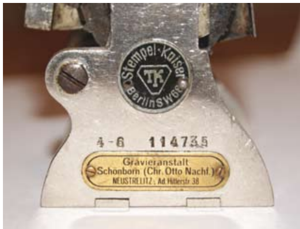
15.–17. Numerator wyprodukowany przez berlińską fabrykę Theodora Kaisera. Widoczna okrągła sygnatura producenta, numer seryjny oraz owalna sygnatura zakładu grawerskiego z Neustrelitz, który jedynie sprzedawał zakupiony i dodatkowo sygnowany przez siebie produkt, metal, drewno, 1. poł. XX w. (zbiory prywatne autora)