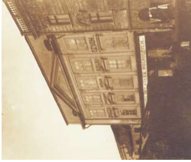
12. Gmach Związku Handlowego Kółek Rolniczych w Krakowie przy pl. Szczepańskim 6, Franciszek Klein, 1908 r.