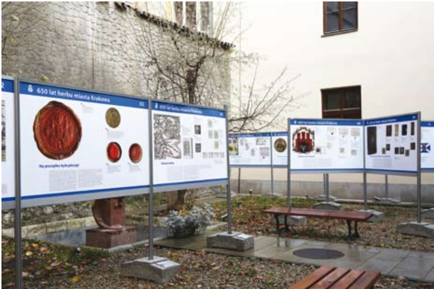
74. Wystawa „650 lat herbu miasta Krakowa” na dziedzińcu wewnętrznym siedziby Archiwum Narodowego w Krakowie przy ul. Siennej 16