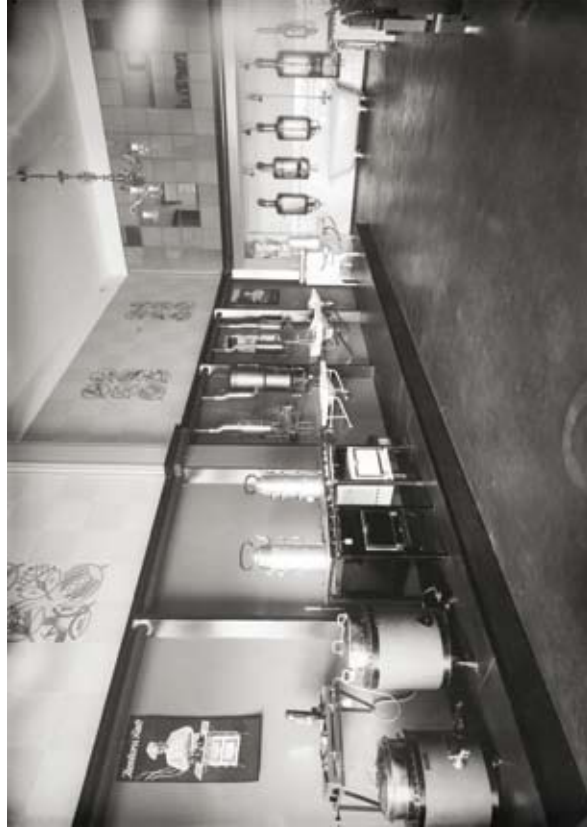
8. Wnętrze sklepu Elektrowni i Gazowni Miejskiej, Stanisław Kolowca, lata 20. XX w., (Muzeum Krakowa, nr inw. MHK-943/N(1))