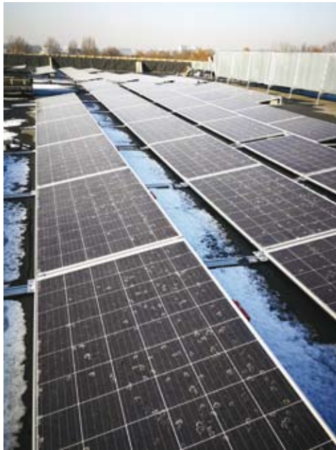
54. Budowa nowej siedziby Archiwum Narodowego w Krakowie. Dach nowego budynku – panele fotowoltaiczne – ekologiczne źródło energii