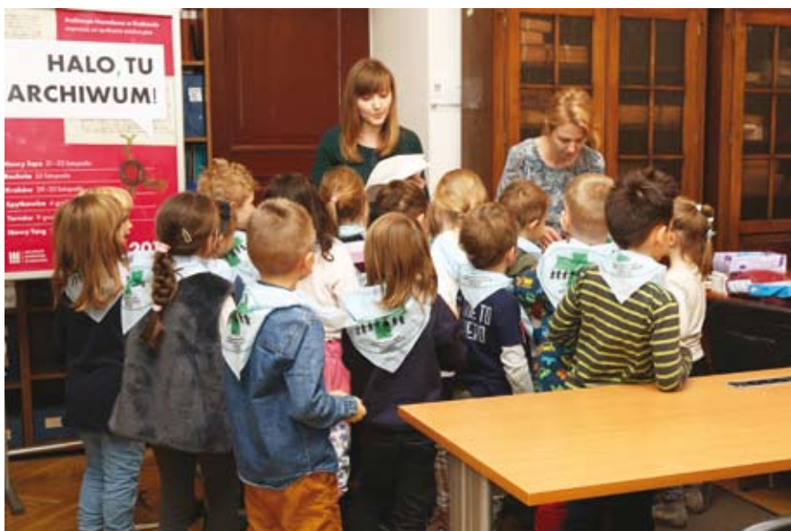
76. „Mały archiwista – moja pierwsza wizyta w archiwum” – warsztaty dla dzieci, prowadzą: Agnieszka Filipek, Agnieszka Jeleń, Kraków, 29 listopada 2019 r.