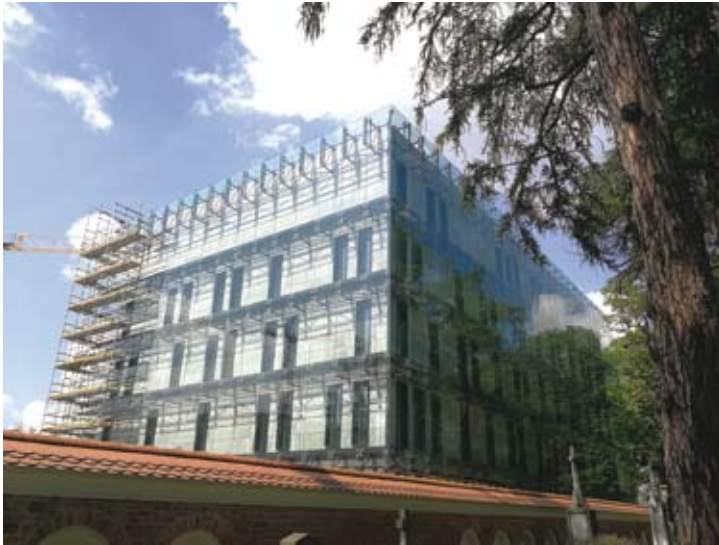
49. Budowa nowej siedziby Archiwum Narodowego w Krakowie. Elewacja segmentu biurowego – widok od strony północno-wschodniej, stan z czerwca 2019 r.