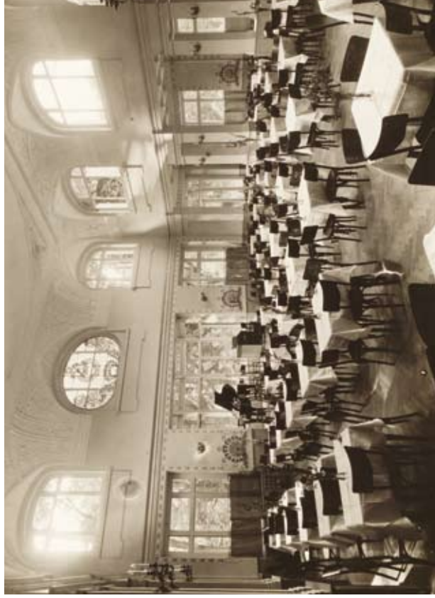
11. Wnętrze restauracji Drobnieron, Agencja Fotograficzna „Światowid”, 1930 r. (Muzeum Krakowa, nr inw. MHK-Fs6879/2/IX)