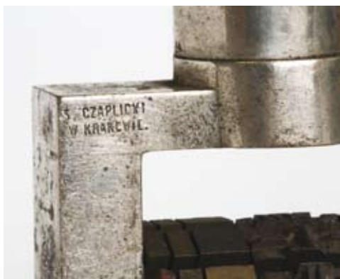
23.–24. Stampila datowa Kasy Miasta Podgórze, metal, drewno, sygnowana przez Stefana Czaplickiego, lata międzywojenne lub nieco późniejsze (do 1. poł. XX w.) (ANK, Zbiór tłoków pieczętnych metalowych, sygn. 29/661/555)