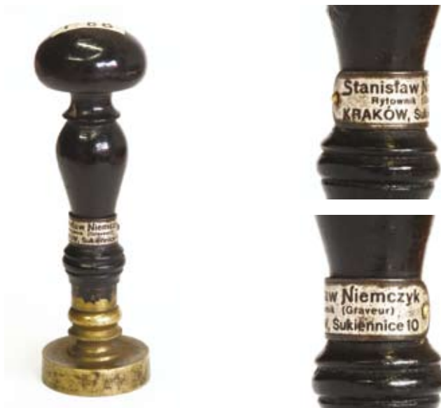
20.–22. Typariusz pieczętny Przytuliska Weteranów w Krakowie, mosiądz, drewno, wyk. Stanisław Niemczyk, lata międzywojenne lub nieco późniejsze (do 1. poł. XX w.) (ANK, Zbiór tłoków pieczętnych metalowych, sygn. 29/661/88)