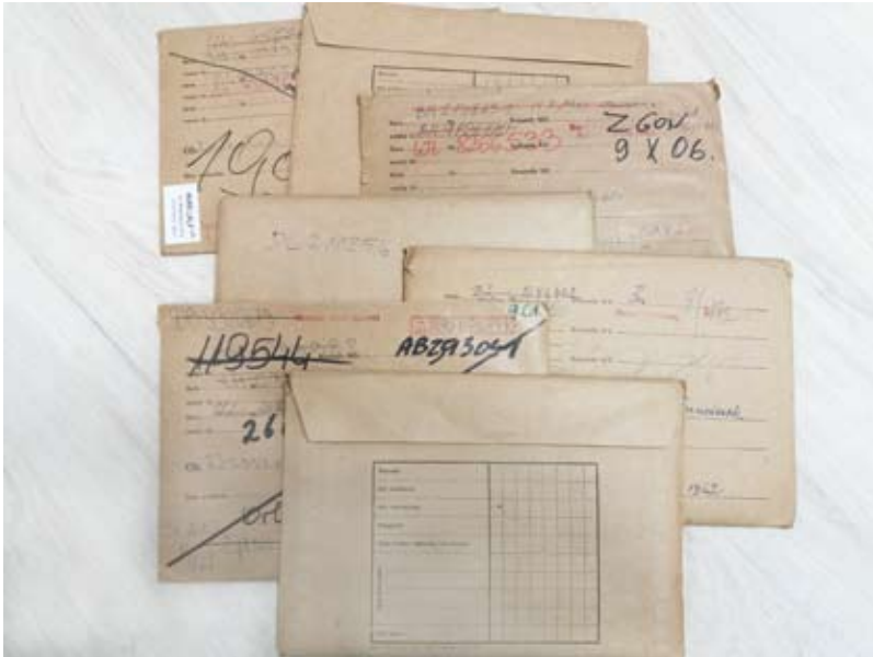
47. Koperty dowodowe przechowywane w zbiorach Archiwum Urzędu Miasta Krakowa