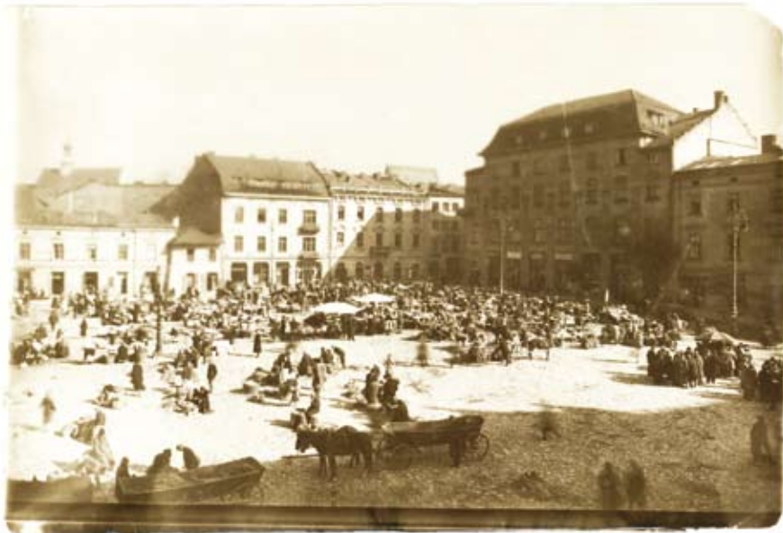
6. Targ na pl. Szczepańskim, Agencja Fotograficzna „Światowid”, 1925 r. (Muzeum Krakowa, nr inw. MHK-Fs582/IX)