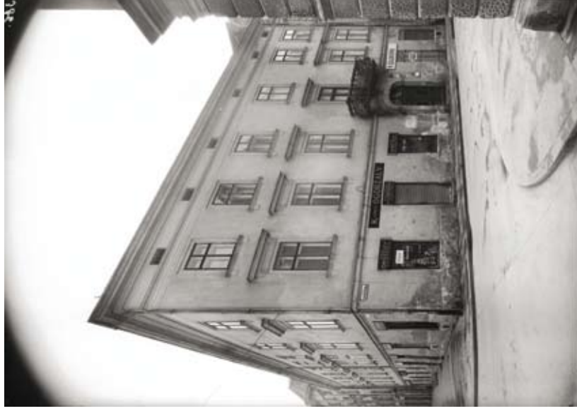
14. Kamienica Szolayskich (sklep kolonialny Kazimierza Ogorzałego), Stanisław Kolowca, [lata 20.–30. XX w.] (Muzeum Krakowa, nr inw. MHK-3216/N(1))