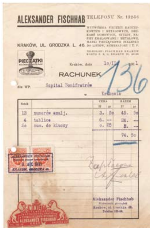
27. Rachunek z 10 lutego 1931 r. wystawiony przez firmę „A. Fischhab” dla Szpitala Bonifratrów w Krakowie