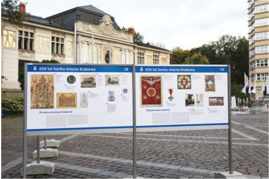
73. Wystawa „650 lat herbu miasta Krakowa” w dniu otwarcia na pl. Szczepańskim w Krakowie