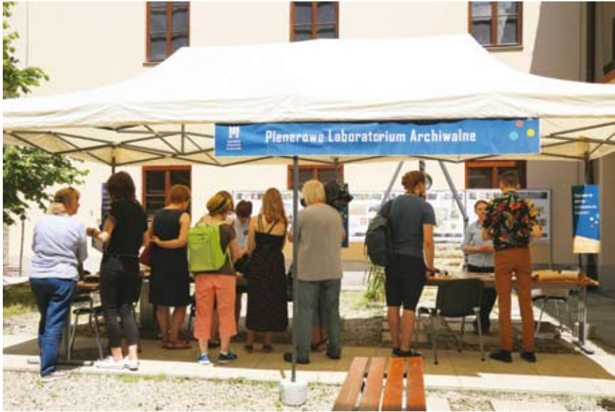
65. „Poczuj historię. Plenerowe Laboratorium Archiwalne” na dziedzińcu budynku przy ul. Siennej 16, 8 czerwca 2019 r. (fot. Małgorzata Multarzyńska-Janikowska)