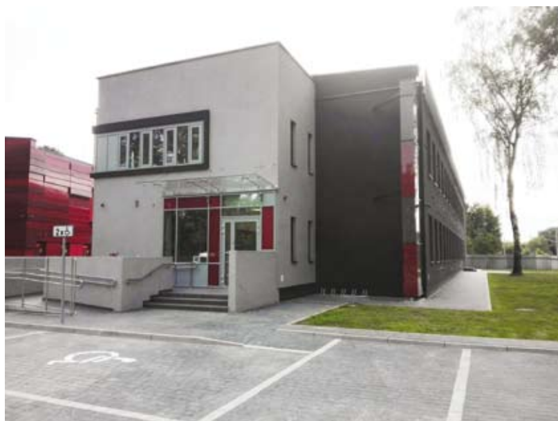
44. Nowa siedziba Archiwum Urzędu Miasta Krakowa przy ul. Na Załączku 2