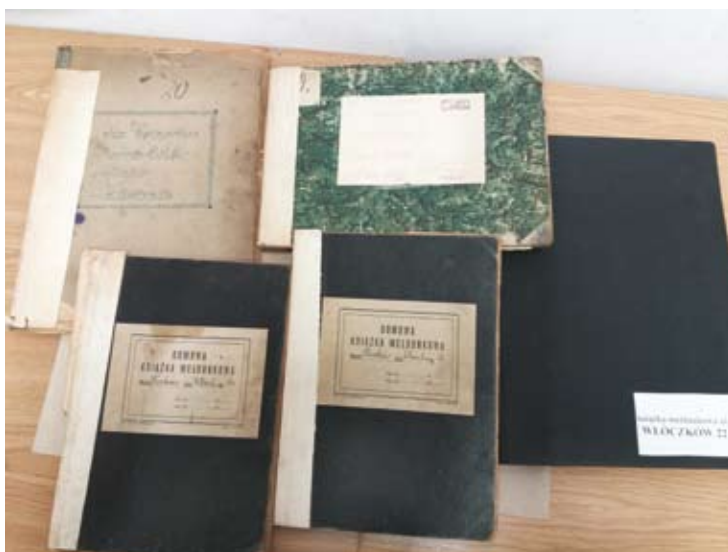
46. Książki meldunkowe z terenu miasta Krakowa znajdujące się w zbiorach Archiwum Urzędu Miasta Krakowa