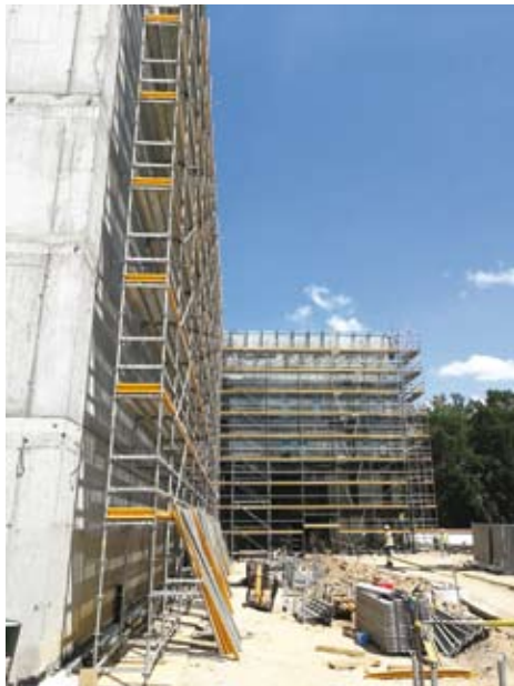
50. Budowa nowej siedziby Archiwum Narodowego w Krakowie. Segment magazynowy (na pierwszym planie) i segment biurowy (drugi plan) – widok od południa, stan z czerwca 2019 r.