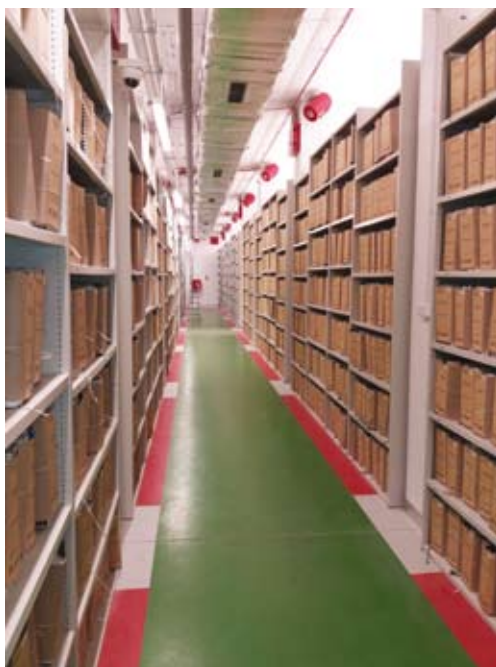
45. Wnętrze jednego z magazynów Archiwum Urzędu Miasta Krakowa