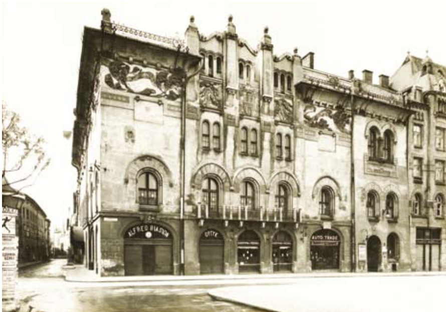
7. Budynek Teatru Starego z widocznym szyldem sklepu Alfreda Biasiona, Stanisław Mucha, ok. 1930 r. (Muzeum Krakowa, nr inw. MHK-Fs20486/IX/2)