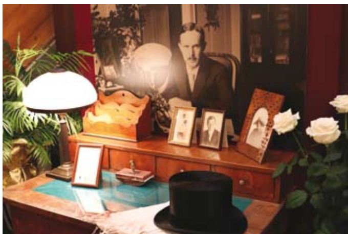
82. Ekspozaty prezentowane na wystawie „Walery Goetel (1889–1972). Urodziłem się jako jeden z tych, którzy mają ciekawość świata... W 130. rocznicę urodzin Walerego Goetla i 100-lecie powstania Akademii Górniczo-Hutniczej w Krakowie” w Archiwum Nauki PAN i PAU, Kraków, 16 października 2019 r.