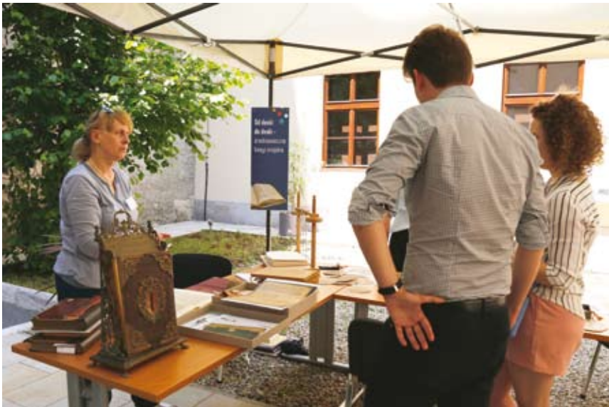
68. „Plenerowe Laboratorium Archiwalne”, stanowisko „Od deski do deski – średniowieczne księgi miejskie”, opieka merytoryczna: Bożena Lesiak-Przybył, 8 czerwca 2019 r.