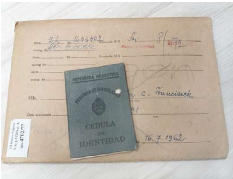
48. Koperty dowodowe zawierają dowody tożsamości wnioskodawców, m.in. paszporty