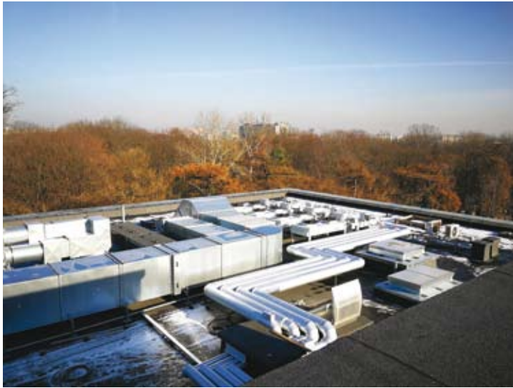
53. Budowa nowej siedziby Archiwum Narodowego w Krakowie. Dach nowego budynku – kanały wentylacyjne i urządzenia zapewniające klimatyzację, widoczna panorama miasta